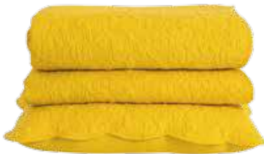
Colcha e capa de almofada, €89,90, Zara Home