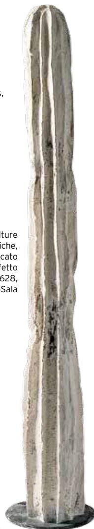
Sculture Domestiche, escultura cato da Imperfetto Lab, €1628, QuartoSala