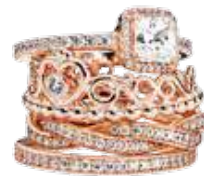
Anéis Pandora: Timeless Elegance, €89; My Princess Tiara, €59; Twist of Fate, €129; e Hearts, €79