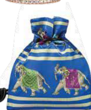
Bolsa, €570, Emporio Armani