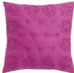
Capa de almofada, €12,99, Zara Home