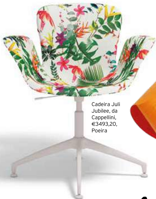
Cadeira Juli Jubilee, da Cappellini, €3493,20, Poeira