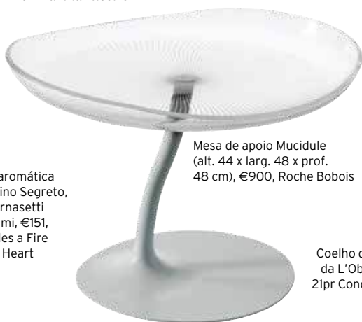
Mesa de apoio Mucidule (alt. 44 x larg. 48 x prof. 48 cm), €900, Roche Bobois