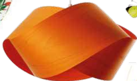
Candeeiro de suspensão Nut S, da LZF, €246, Traços Interiores