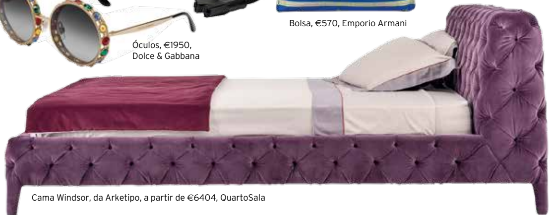
Cama Windsor, da Arketipo, a partir de €6404, QuartoSala