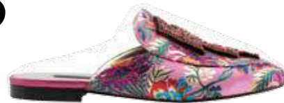
Mocassin sem calcanhar e com cristais, €49,99, Mango

Não tanto pelo exagero de formas ou cores, mas mais pela profusão de possibilidades e pela liberdade de conexão. Uma vibrante influência que chega do oriente Por Marina Ribeiro