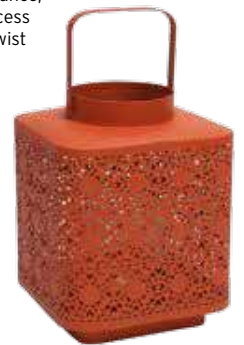
Lanterna para vela, €29,99, Zara Home