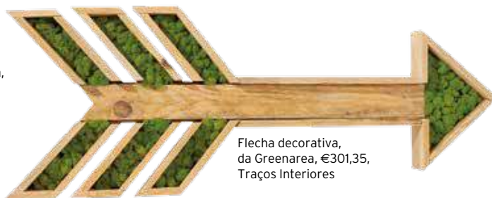
Flecha decorativa, da Greenarea, €301,35, Traços Interiores