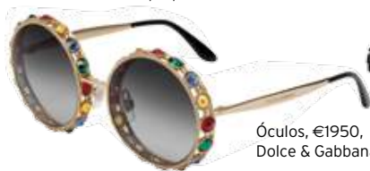
Óculos, €1950, Dolce & Gabbana