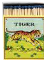
Caixa de fósforos Tiger, da Archivist, €12,50, 21pr Concept.Store