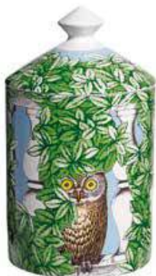
Vela aromática Giardino Segreto, da Fornasetti Profumi, €151, Candles a Fire in My Heart