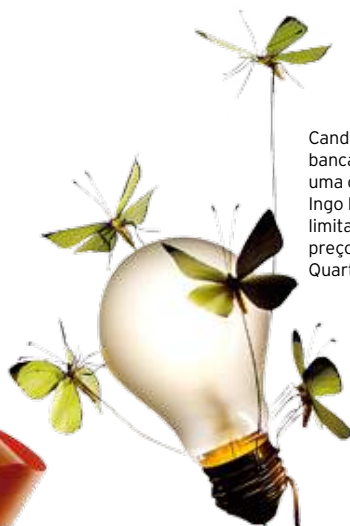
Candeeiro de bancada Butterflies, uma criação de Ingo Maurer, edição limitada a 200 peças, preço sob consulta, QuartoSala