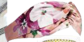
Fita para a cabeça, Gucci, €250, Fashion Clinic