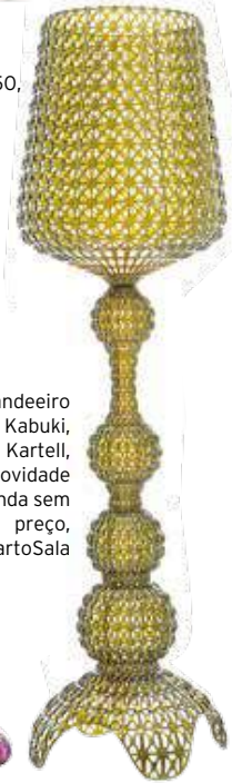
Candeeiro Kabuki, da Kartell, novidade ainda sem preço, QuartoSala