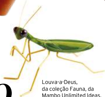
Louva-a-Deus, da coleção Fauna, da Mambo Unlimited Ideas, €98, na Roof Design Studio