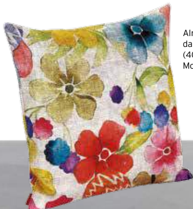
Almofada Pamplona, da Missoni, (40x40 cm), €230, Moyo Concept