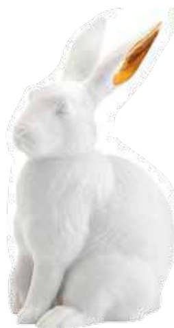
Coelho decorativo da L'Objet, €302, 21pr Concept.Store