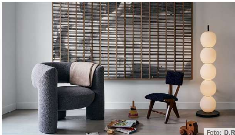
Coleção de Man of Parts.

Para ninguém em particular. Desenho para seres humanos, porque embora os nossos gostos sejam muito diferentes, as necessidades básicas são muito parecidas, em qualquer parte do mundo. A forma e a função são sempre importantes.