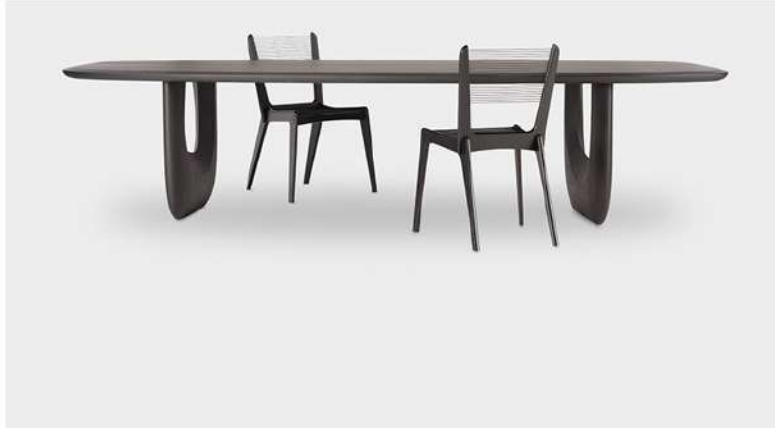
Savini Table, versão mesa de jantar.

A ideia para a mesa – que recebe nome em homenagem à Savini Platz, uma zona boémia de Berlim – surgiu-lhe já em pleno confinamento, enquanto pensava na importância do contacto humano. Como mesa generosa que é, pretende ser um novo espaço de encontros e de reunião, algo que nós, portugueses, compreendemos muito bem.