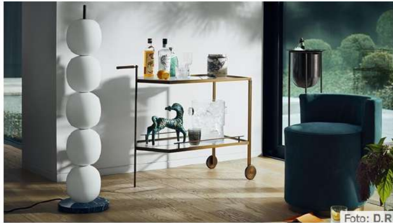
Coleção de Man of Parts.

Temos um projeto em andamento com mármore. Uns vasos, para a secretária que devem ser apresentados no início do próximo ano.