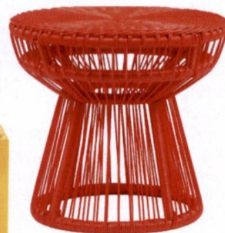
Mesa de apoio Salsa John Lewis 94,50€