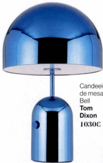
Candeeiro de mesa Bell Tom Dixon 1030€