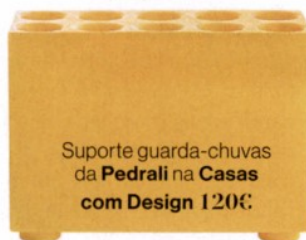
Suporte guarda-chuvas da Pedrali na Casas com Design 120€