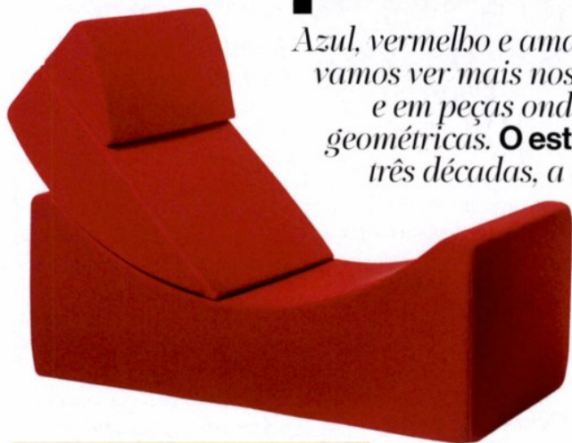
Sofá Moon Lina, na Loja Inexistência 349€

Azul, vermelho e amarelo são cores que vamos ver mais nos seus tons originais e em peças onde dominam as formas geométricas. O estilo Memphis volta, após três décadas, a adornar os interiores de casas, botéis e lojas.