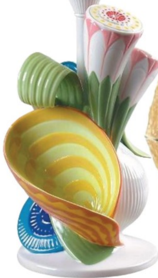
CANDEIRO De mesa, em porcelana, mede 41x12cm, Lladró