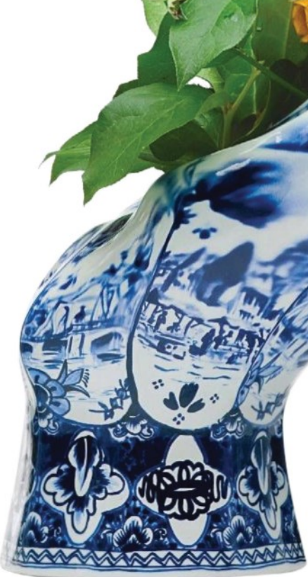
JARRA Cerâmica, design da Front para a Moooi, QuartoSala