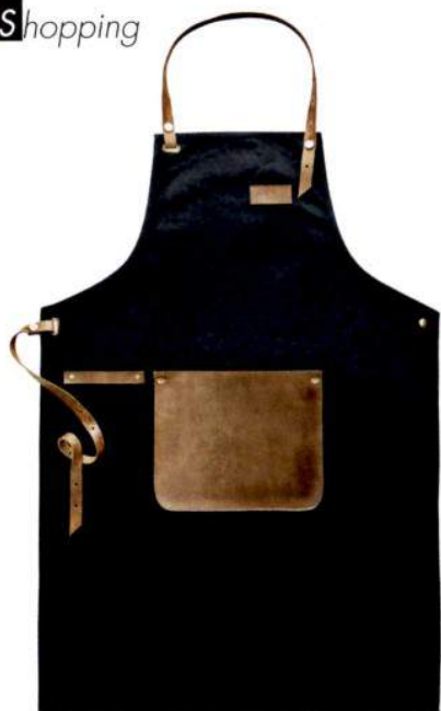
Avental preto com cabedal, da Eva Solo. (*) Em www.loja.inexistencia.com