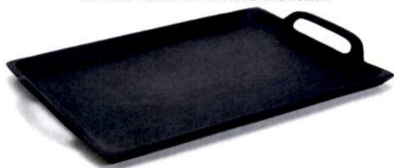
Bandeja de metal mate, € 29,99, da Zara Home. Em www.zarahome.com