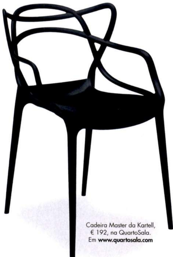
Cadeira Master da Kartell, € 192, na QuartoSala. Em www.quartosala.com