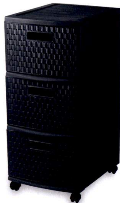
Modulo de três gavetas, a partir de € 19,99, do DeBorla. Em www.deborla.pt