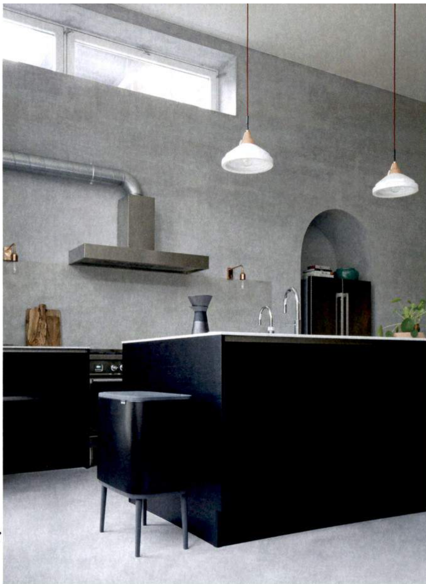
Ambiente de cozinha equipado com balde de lixo Bo, com sistema de abertura e fecho Soft-Touch, a partir de € 143,10, da Brabantia, na Pollux. Em www.pollux.pt