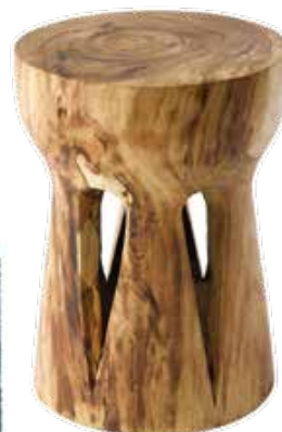
Banco de madeira de look natura, preço sob consulta, La Redoute