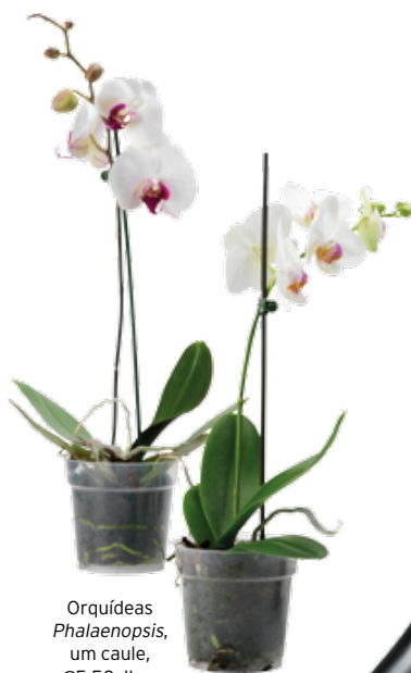
Orquídeas Phalaenopsis , um caule, €5,50, Ikea