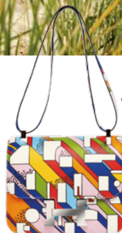
Mala Constance III, com print On a Summer Day, €9800, Hermès