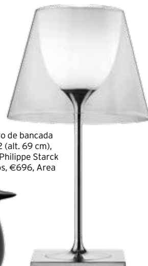
Candeeiro de bancada Ktribe T2 (alt. 69 cm), design de Philippe Starck para a Flos, €696, Area