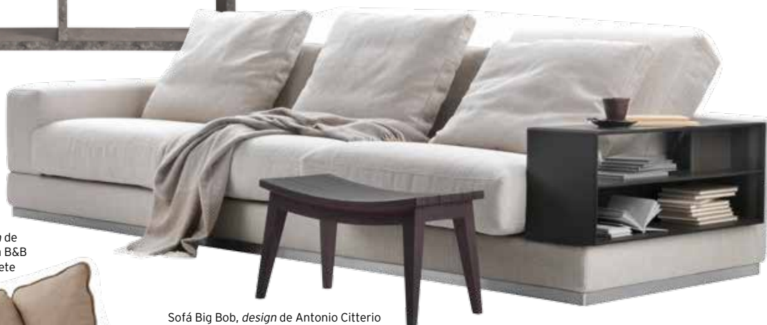
Sofá Big Bob, design de Antonio Citterio para a Flexform, €6032, Paris:Sete