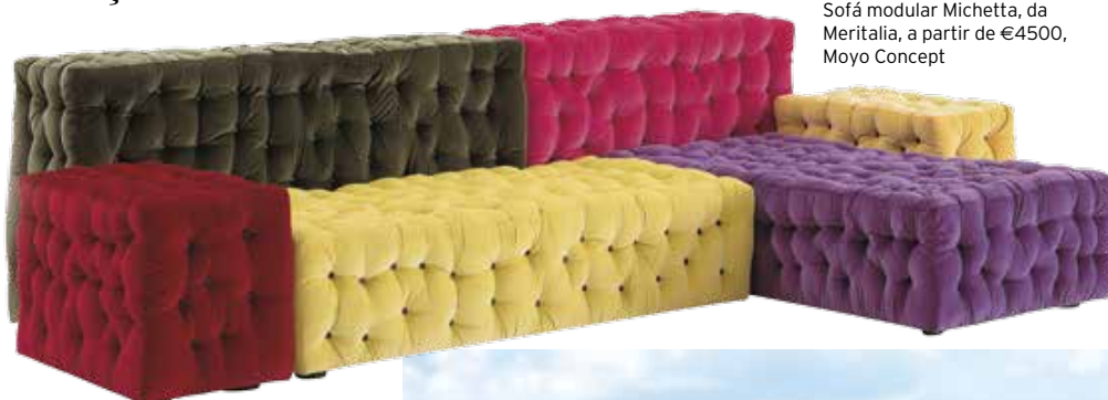
Sofá modular Michetta, da Meritalia, a partir de €4500, Moyo Concept