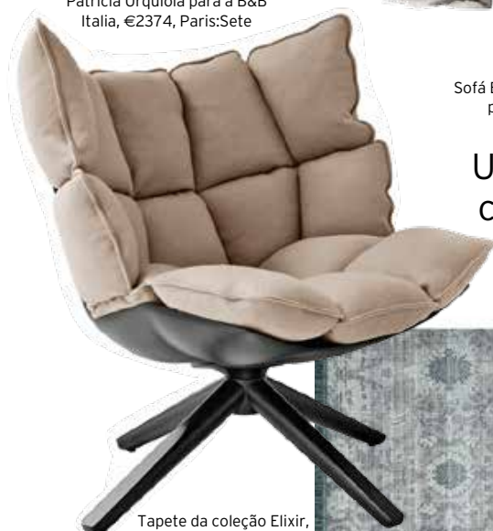
Tapete da coleção Elixir, da Limited Edition, a partir de €1659, QuartoSala