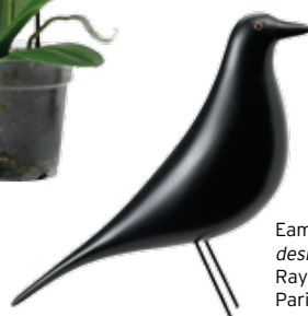
Eames House Bird, design de Charles & Ray Eames, Vitra, €172, Paris:Sete