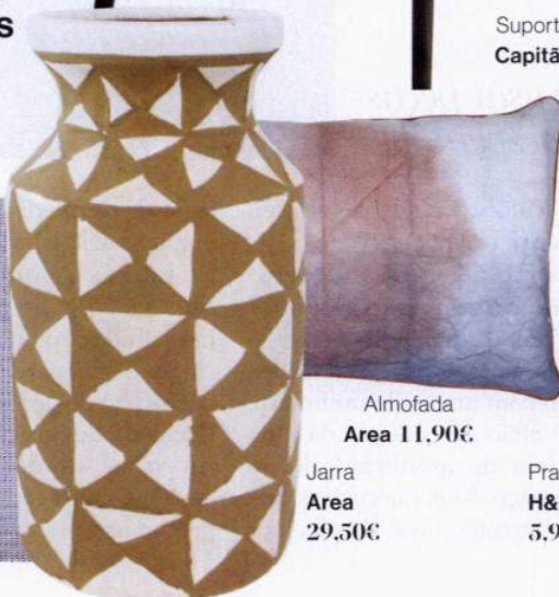
Almofada Area 11,90€