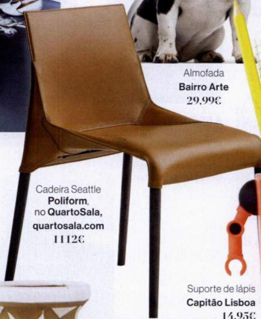
Cadeira Seattle Poliform, no QuartoSala, quartosala.com 1112€