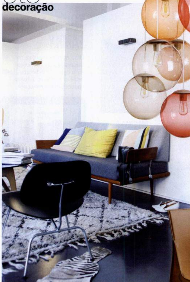
Candeeiro de teto Spheremaker Fatboy, em shop. fatboy.com 599,95€