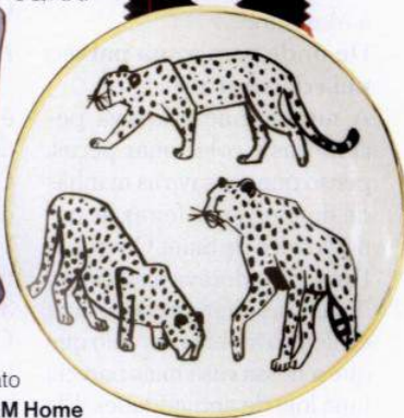
Prato H&M Home 5,99€