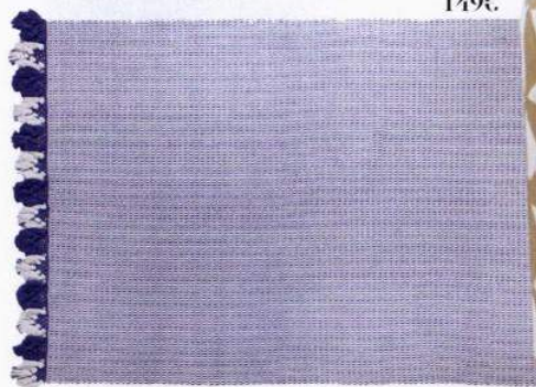
Tapete Zara Home 149€