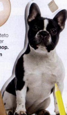
Almofada Bairro Arte 29,99€