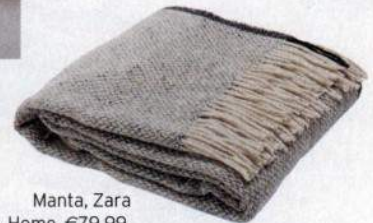
Manta, Zara Home, €79,99,