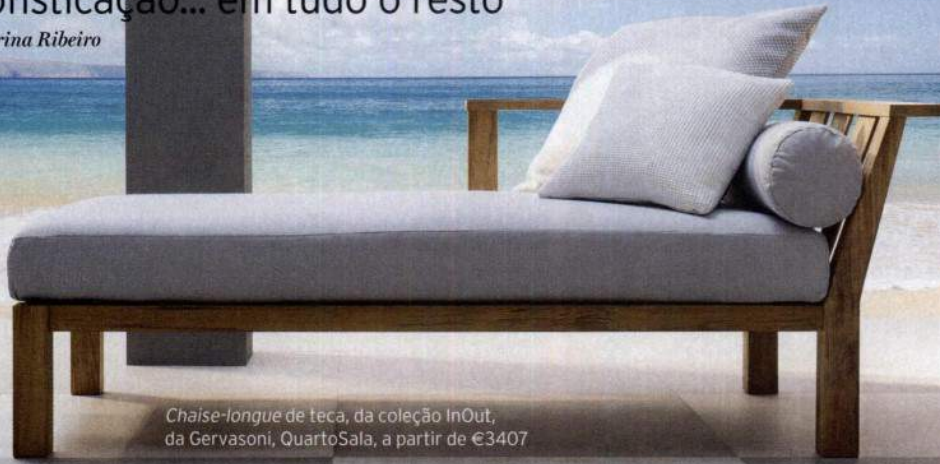
Chaise-longue de teca, da coleção InOut, da Gervasoni, QuartoSala, a partir de €3407