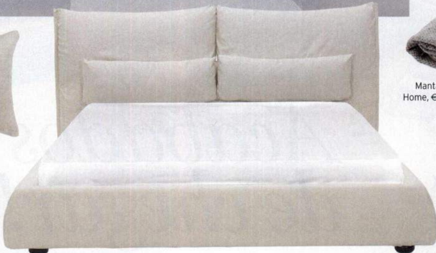
Cama Salvatore (larg. 194 x alt. 93 x prof. 229 cm), Area, €890