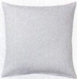
Capa de almofada Vigdis, Ikea, €9,99