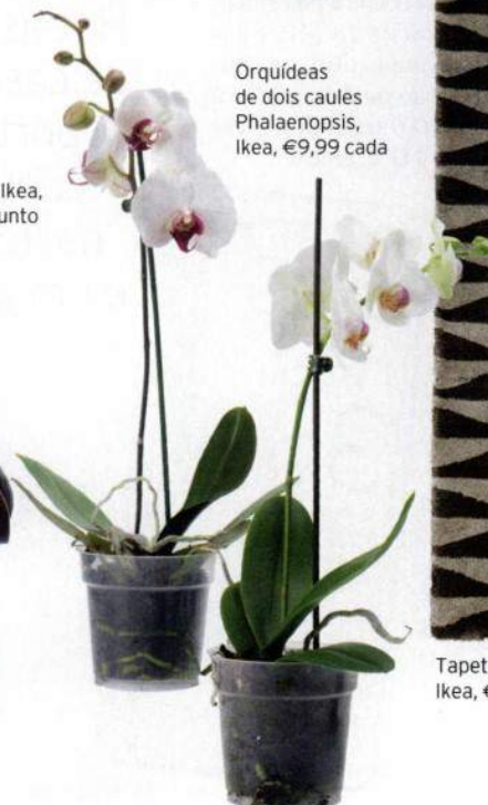
Orquídeas de dois caules Phalaenopsis, Ikea, €9,99 cada