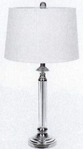
Candeeiro de bancada Metal e Cristal, Zara Home, €59,99