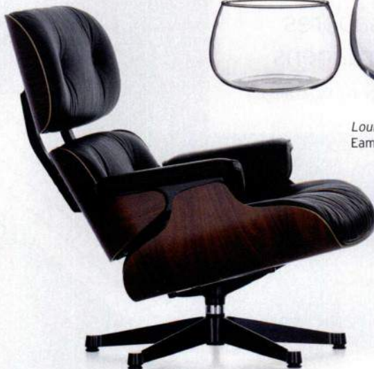
Lounge chair, design de Charles e Ray Eames para a Vitra, Paris:Sete, €7011