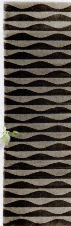
Tapete Mullerup, Ikea, €229