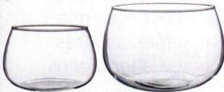
Jarras Viktig, Ikea, €19,99 o conjunto de duas