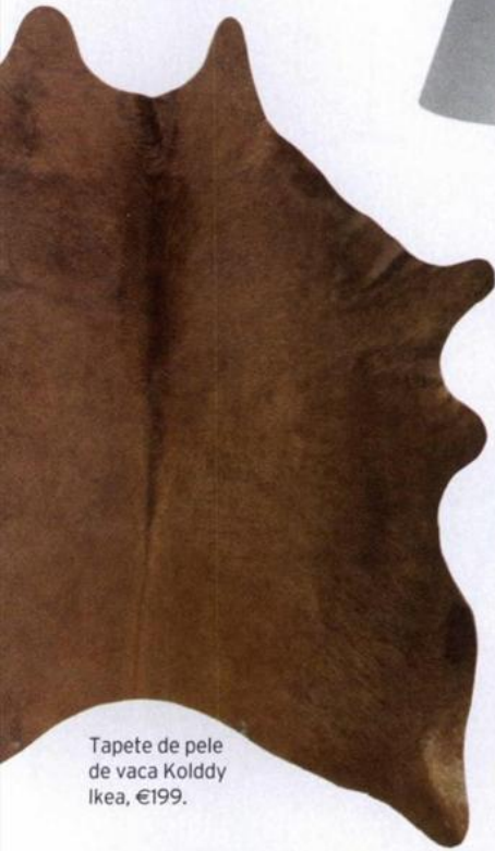
Tapete de pele de vaca Kolddy Ikea, €199.