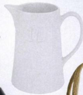
Leiteira Loja Viva online, €4,99.