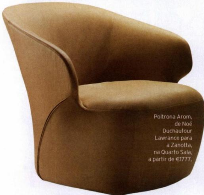
Poltrona Arom, de Noé Duchaufour Lawrance para a Zanotta, na Quarto Sala, a partir de €1777.