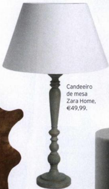
Candeeiro de mesa Zara Home, €49,99.