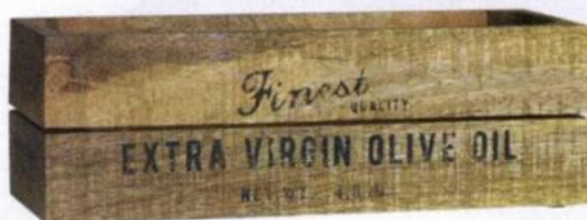
Caixa de madeira H&M, €14,99.