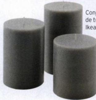
Conjunto de três velas Ikea, €4,99.