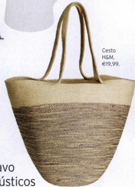
Cesto H&M, €19,99.

Em casa da arquiteta de interiores, o minimalismo do design escandinavo anda de mãos dadas com objetos rústicos e de inspiração industrial. Por Cátia Pereira Matos