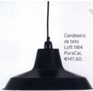
Candeeiro de teto Loft 1184 PuraCal, €147,60.