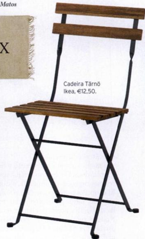
Cadeira Tärnö Ikea, €12,50.