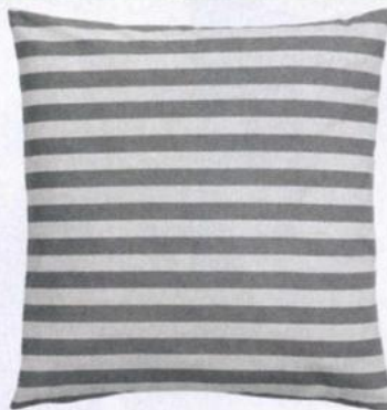
Capa de almofada de algodão H&M, €4,95.