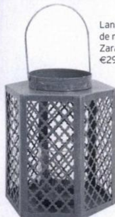
Lanterna de metal Zara Home, €29,99.