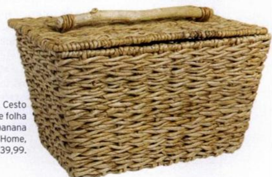
Cesto de folha de banana Zara Home, €39,99.