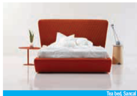
Tea bed, Sancal