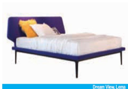
Dream View, Lema

QuartoSala Projectos Decoração e Design Tel: 214 411 110 www.quartosala.com www.facebook.com/QuartoSala