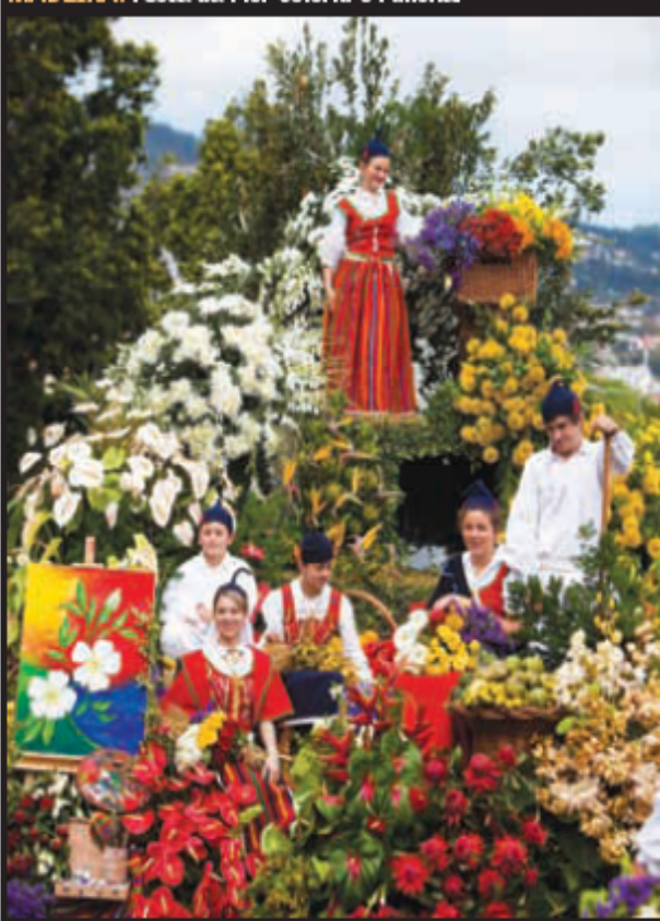
TRAJES típicos e carros vestidos de flores durante o Grande Cortejo da Flor, no Rancho, ilha da Madeira, durante este fim-de-semana. Esta celebração da Primavera é uma das maiores atracções da ilha do Atlântico.