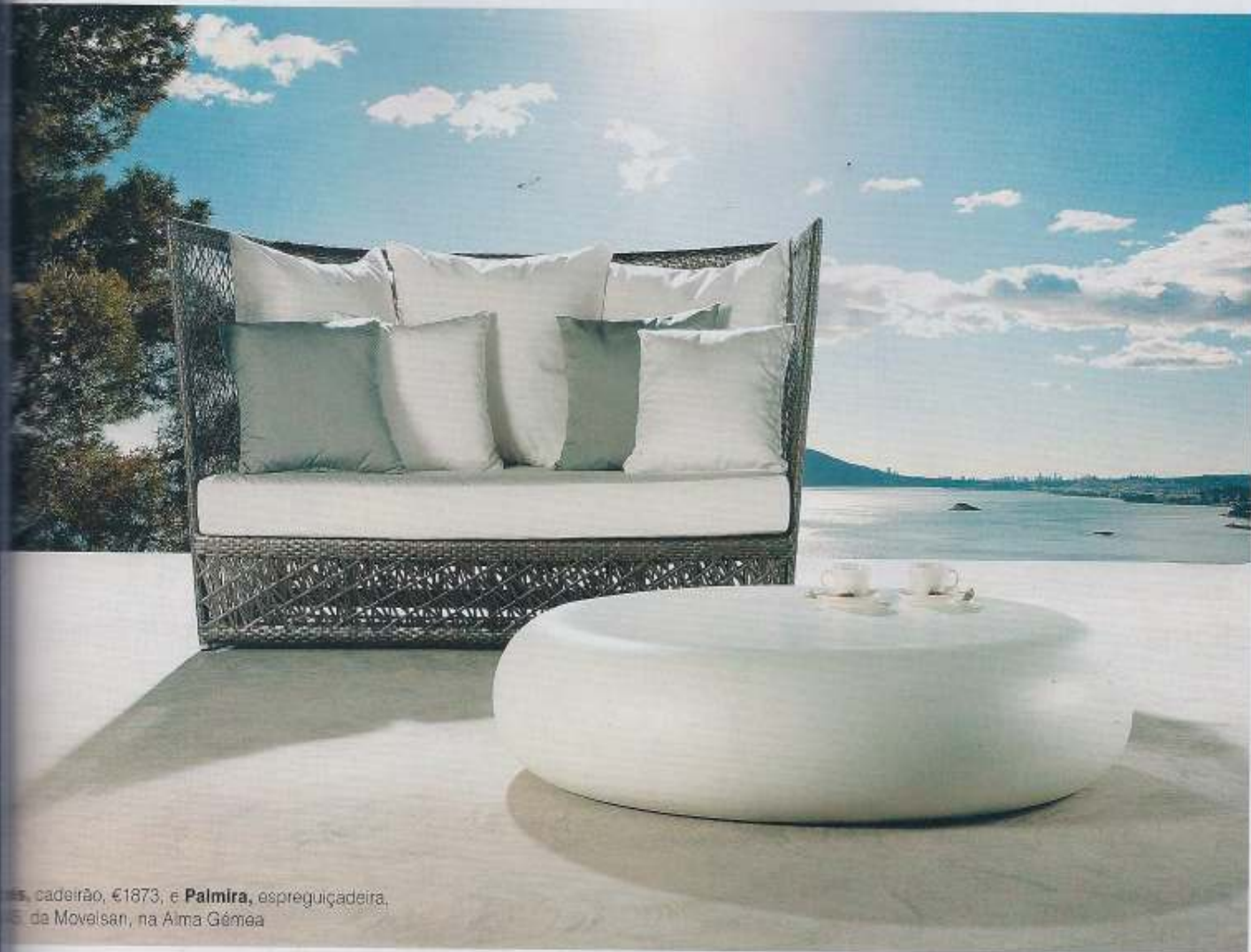
Palmira , cadeirão, €1873, e Palmira , espreguiçadeira, da Moveisan, na Alma Gêmea