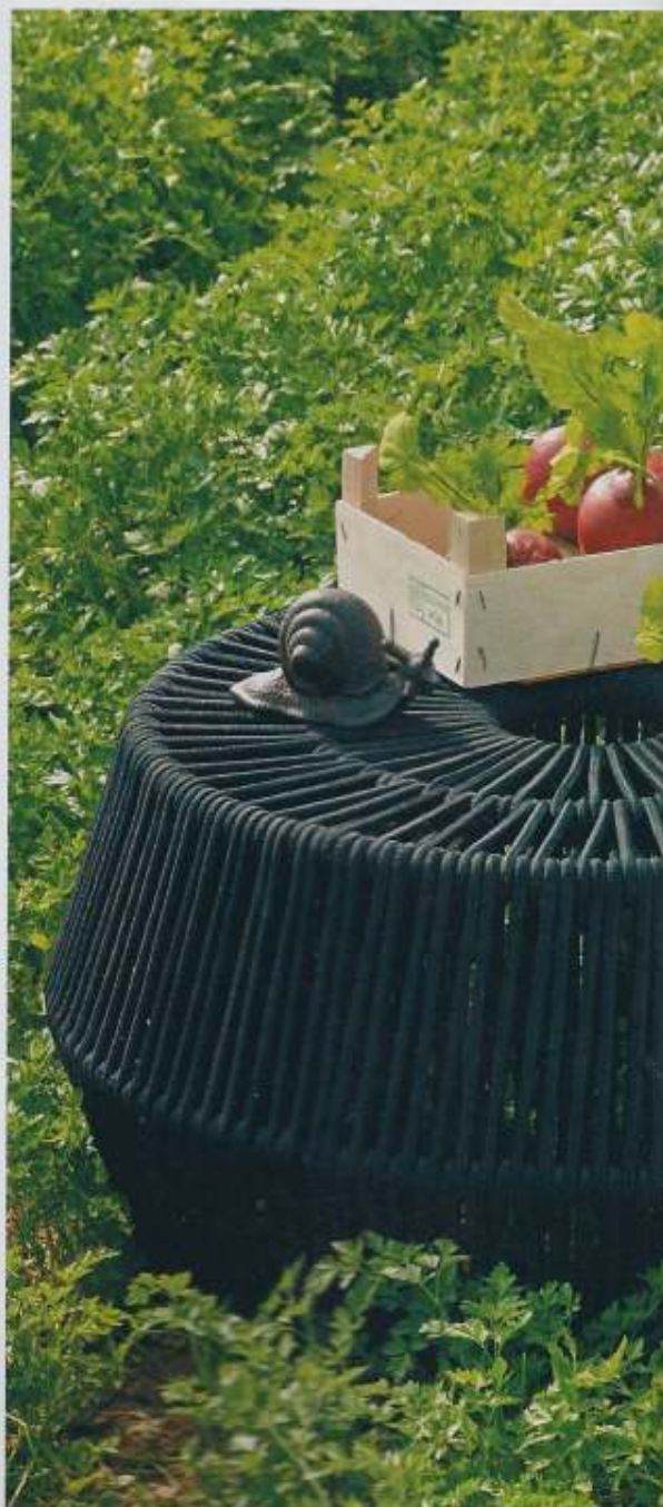
Banco/mesa de apoio Zig Zag , da Kettal, em corda resistente, €736, na QuartoSala. Caracol de ferro decorativo , €5,28, na Quinta da Eira. Beterrabas decorativas , €3,75/cada, na Geneviève Lethu