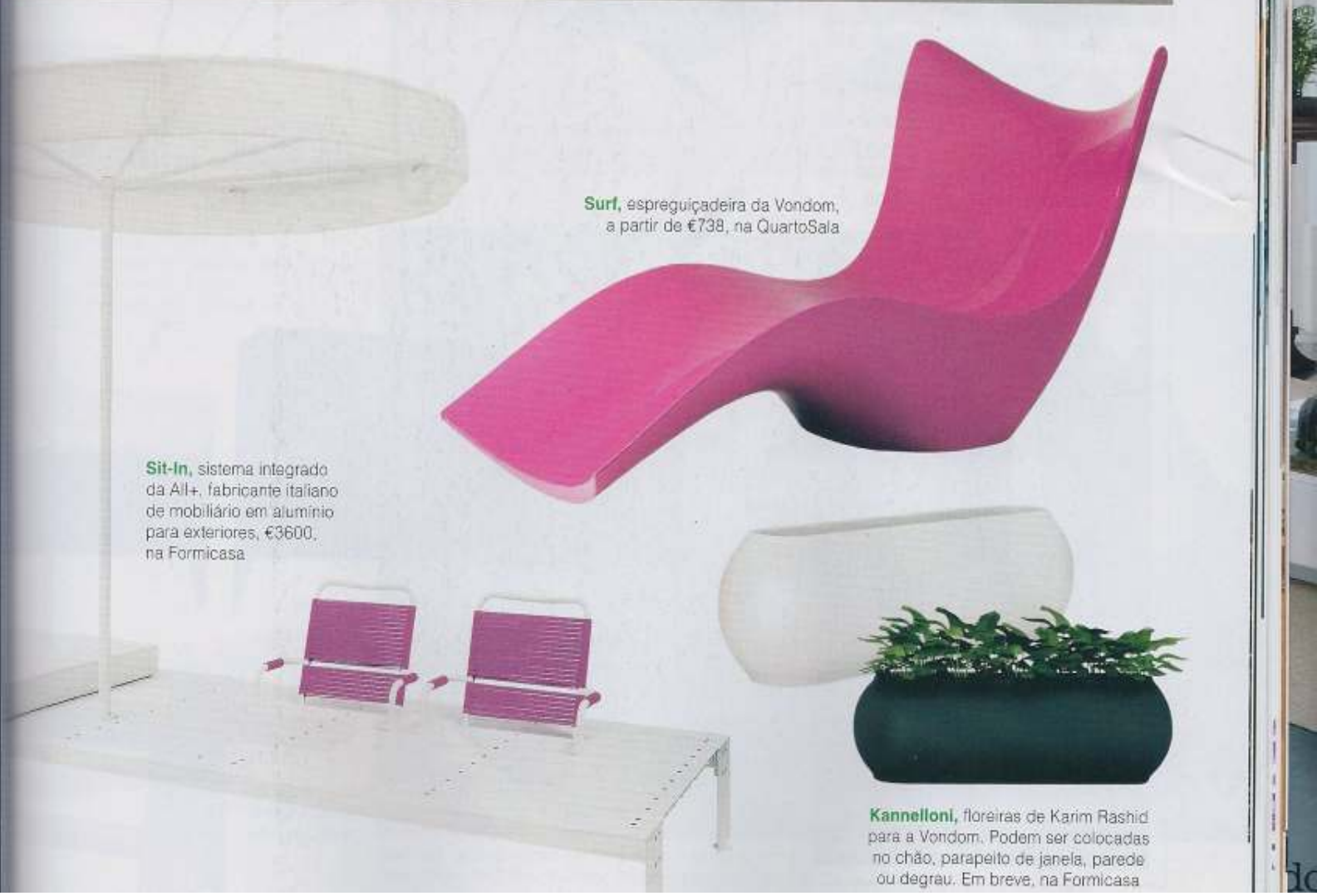
Surf , espreguiçadeira da Vondom, a partir de €738, na QuartoSala