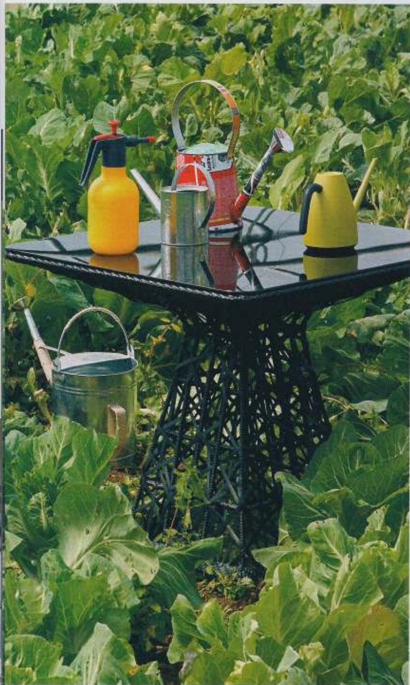
Mesa Mala , design de Patricia Urquiola para Kettal, €1503, na QuartoSala. Pulverizador , €16,42, e regador Neptunus , em zinco, €9,35, na Quinta da Eira. Regador Mezcla , em metal reciclado, €19,90, na Area. Regador verde , €13,77, na Viplant